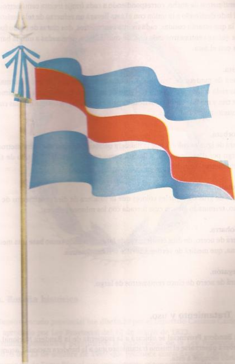
Bandera de Entre Ríos