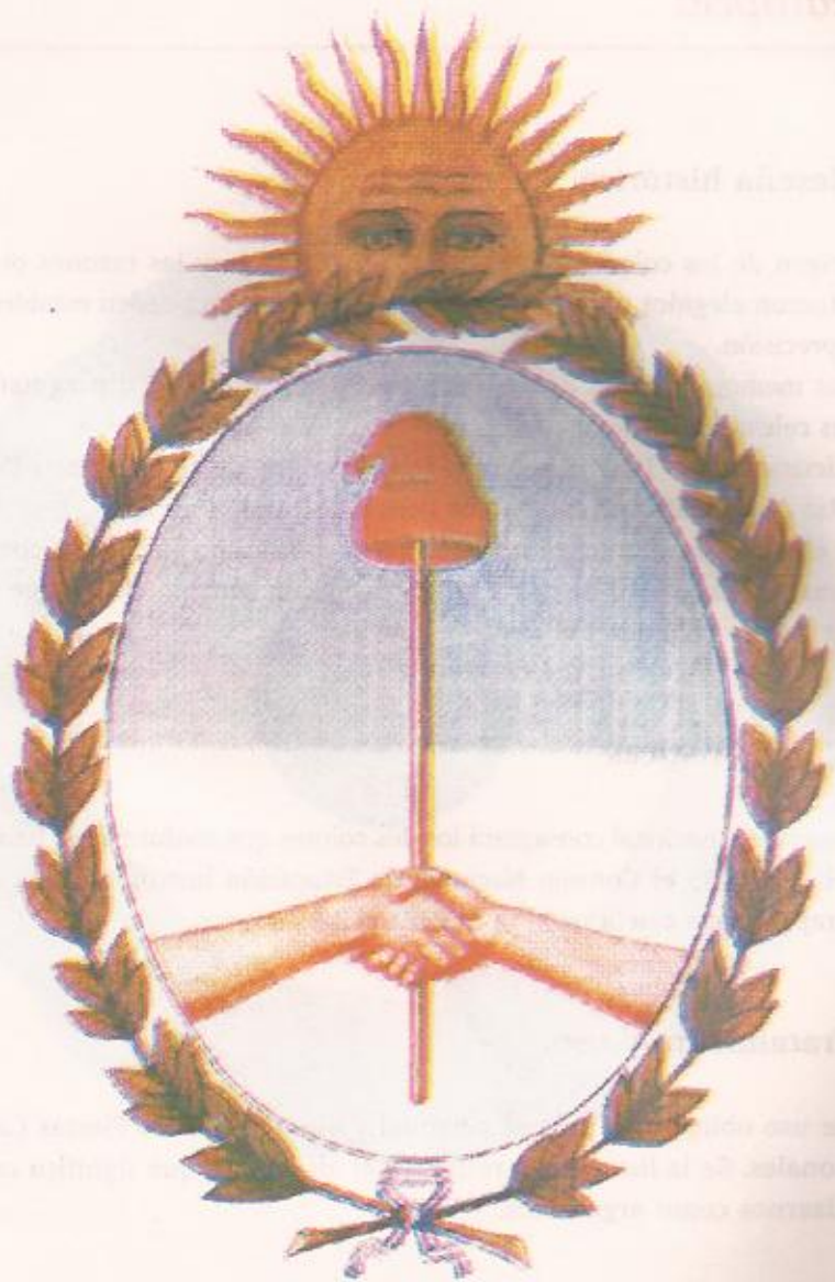
Escudo de la Nación Argentina